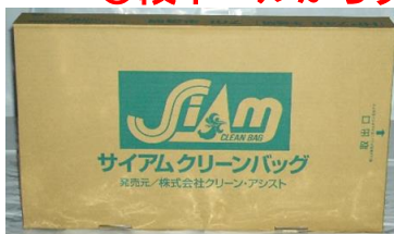
段ボールのパッケージ 外装重量200g