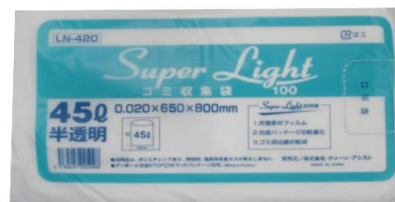
弊社ライトパッケージ 外装重量20g